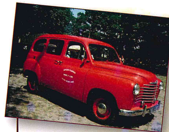
5 RENAULT PRAIRIE COLORALE (1953) Camionnette Incendie