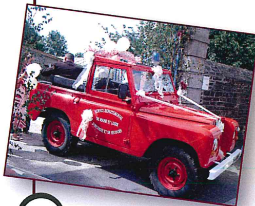
1 LAND ROVER TYPE 88 (1970)

vous propose la location de véhicules et matériels anciens des sapeurs-pompiers de Maine-et-Loire.