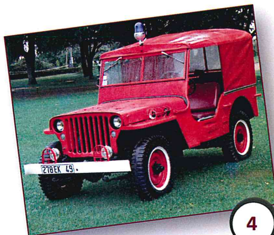
4 VLHR JEEP WYLLIS