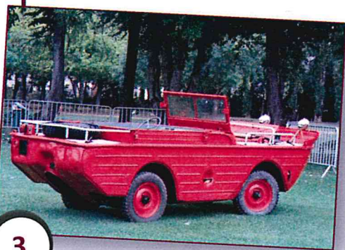
3 JEEP AMPHIBIE FORD GPA (1942)